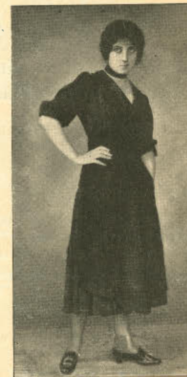
Frk. Musidora fra Folies Bergères i Paris, som »Yrma Vep« i »Vampyrerne II«

Og da der i Marts vil komme endnu flere Film af Betydning, vil Teatrene i Danmark og Norge sik-