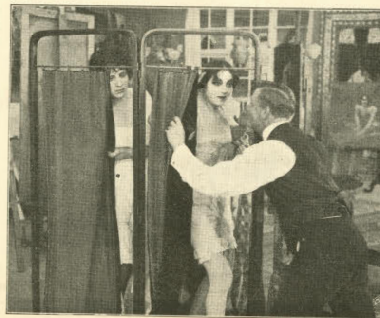
Dette Billede fra den morsomme Film er forbudt af Censuren.