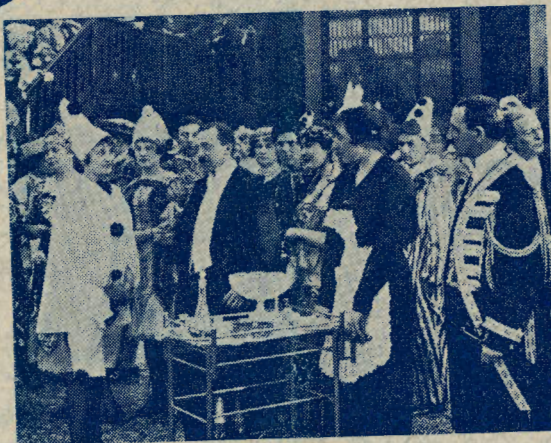
»Den stribede Domino«