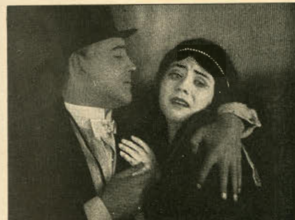
Af »En Sangerindes Eventyr«.

i det mystiske Hus. 4 Akter. Stor Sukces.