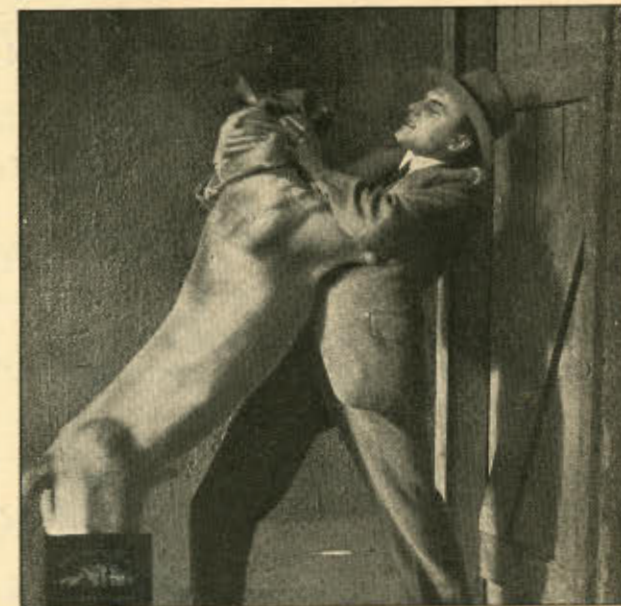
Af »Nattens Gaade«.