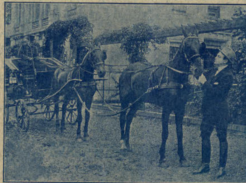
»Af X paa Muren.