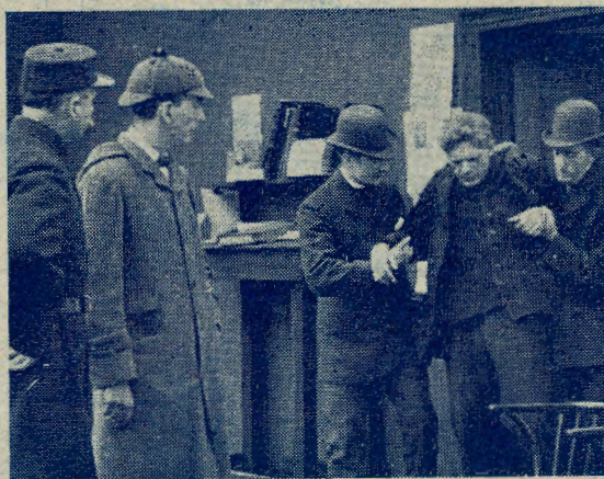
»En Studie i Rødt«