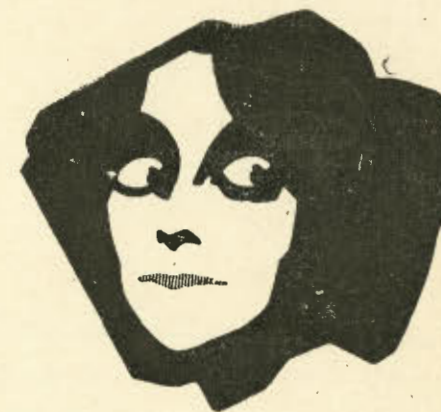
Det sidste Billede af Asta Nielsen.