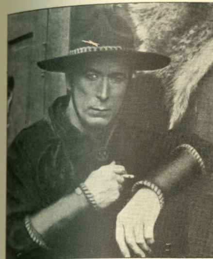
William S. Hart.