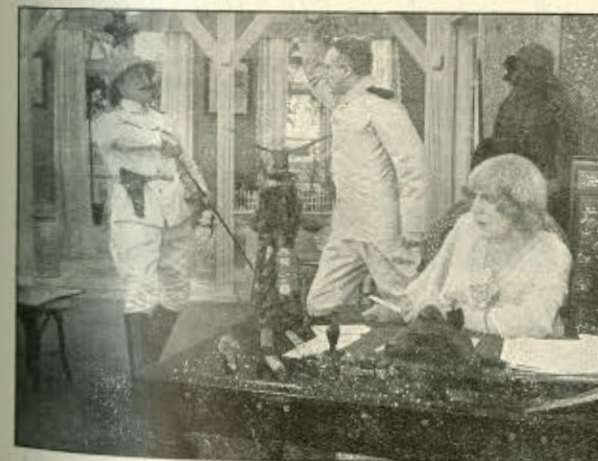
Af »Under Galgen«.