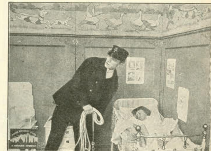
Af »Statens Kurer«.