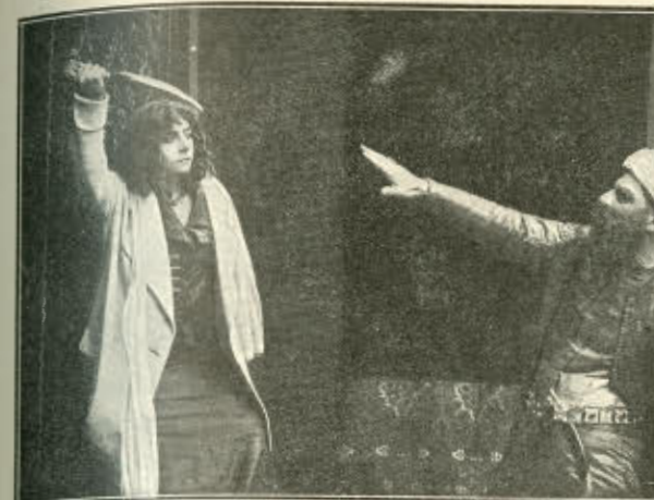
Af »Haremets Perle«.