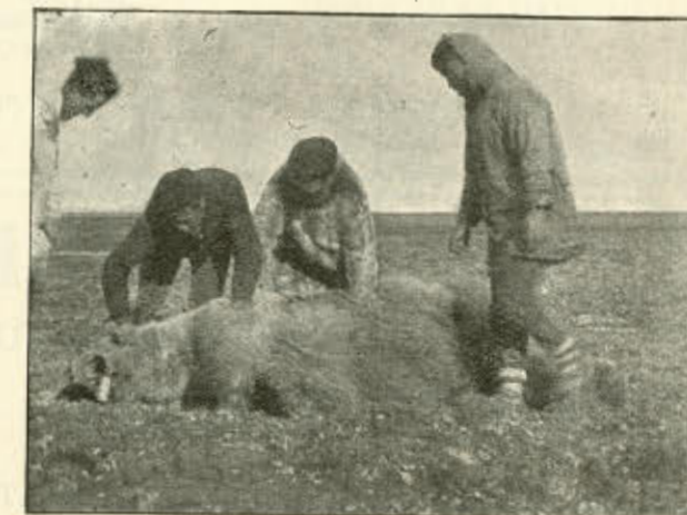
Af »Polar Ekspedition«.