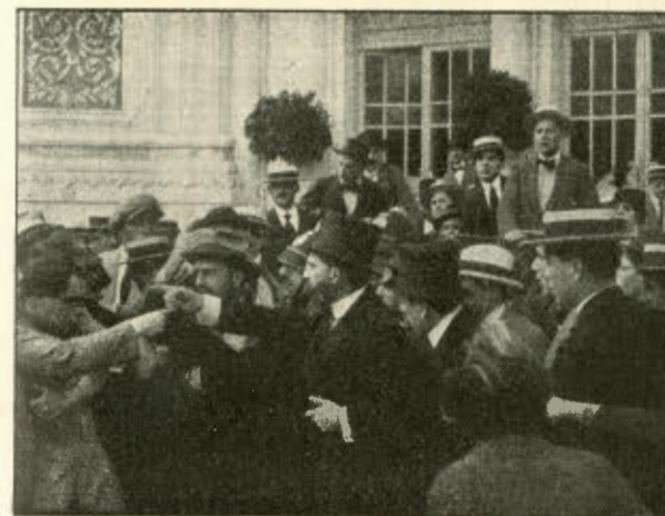
Af Attentatet paa Ministeren.

Lej disse og alle vore andre glimrende Monopol-Film!