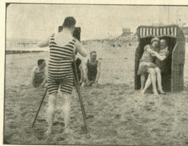
Af »Det muntre Badeliv«.

Den morsomste Sommerfilm. 3 Akter. Eneret: Kinografen.