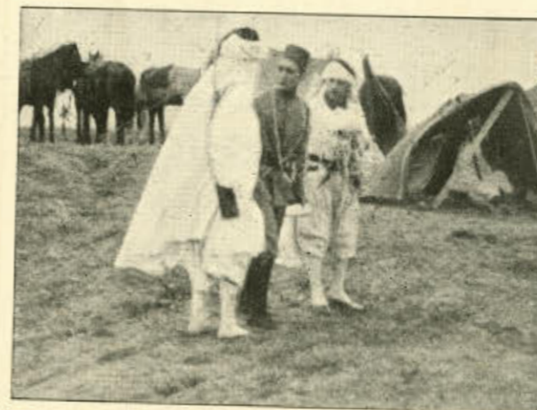
Af »Tyrkens Harem«