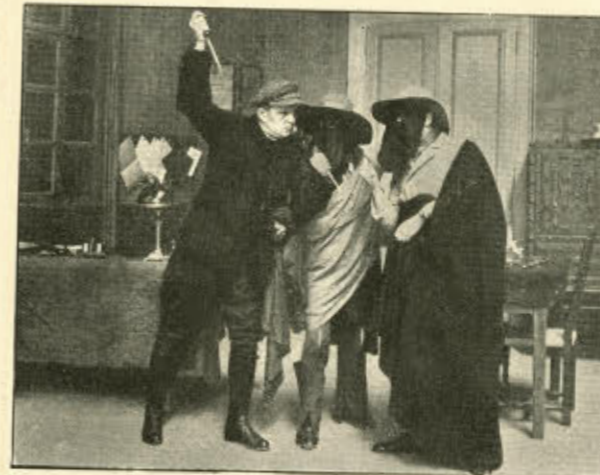
Af »Fange 555's Hemmelighed«