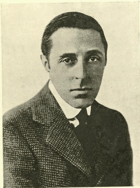
D. W. GRIFFITH.