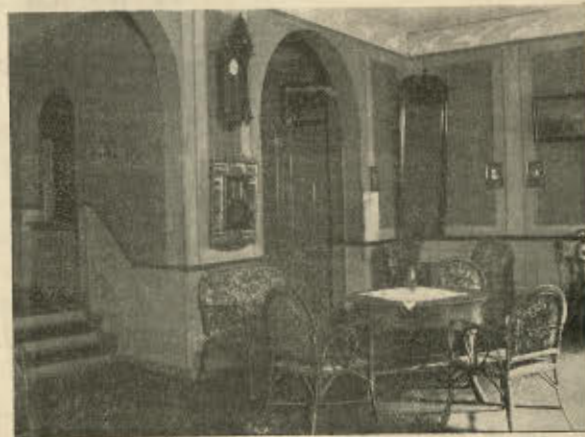
Slagelse Biograftheater kører „Ernemann“.