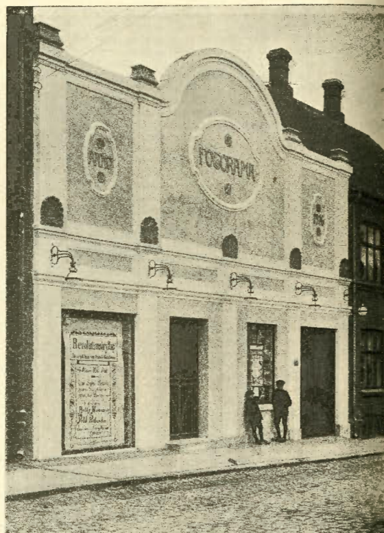
Fotorama, Odde, kører „Ernemann“.

Vi bringer i Dag et Facadebillede af Fotorama i Odde. Selve Teatret er indvendig 13½ × 25 Alen Gulvflade, buet Loft med 9 Alen fra Gulv til Loft, Tæppet indrammet i sort Fløjl. Stolerækkerne i en Kolonne med Gang omkring og 192 Siddepladser, Venteværelse 8 × 8 Alen. Aaben Forgang med Jærngitterlaage.