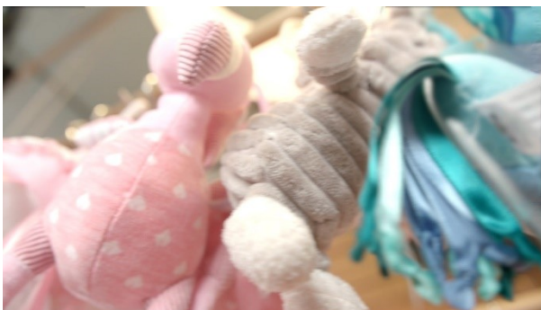
BAMSER HÆNGER I BUTIK