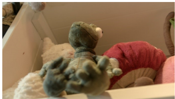
BAMSER PÅ HYLDER